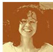
Nuzia Santos Fiocruz Minas BibMINAS